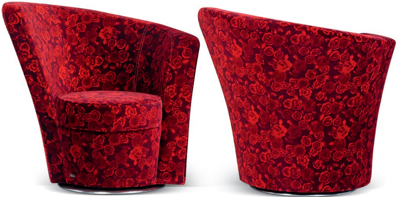
A 144 LI / RE EVE'S ISLAND ▶ 89 CM ▶ 177 CM ▶ 90 CM STOFF · TISSU · FABRIC 64 4115