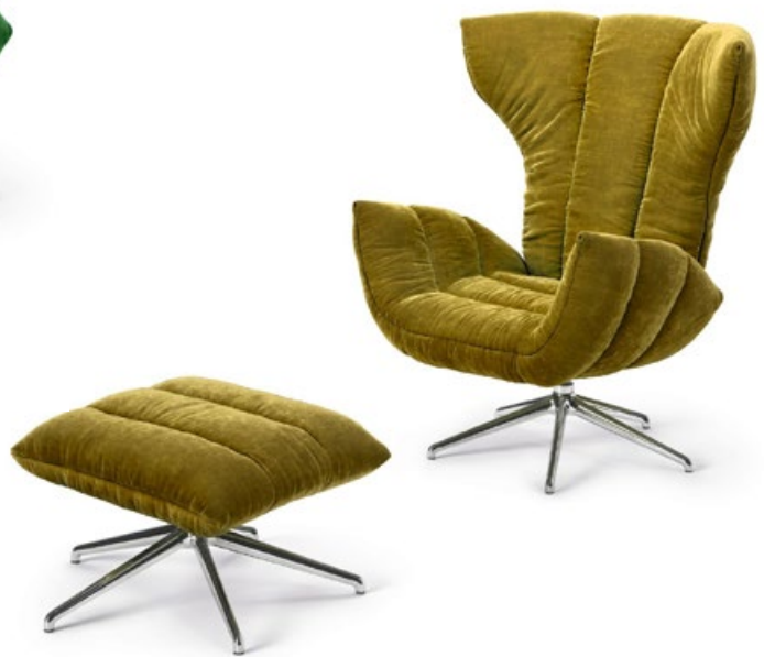
Stoff · Fabric · Tissu gold green 64 1978