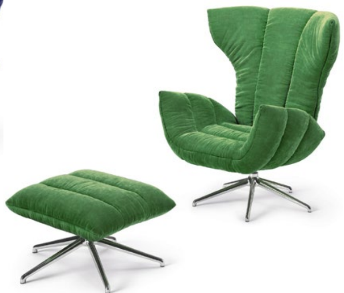
Stoff · Fabric · Tissu kelly green 66 9533