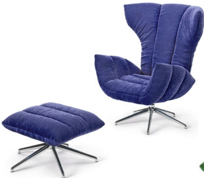
Stoff · Fabric · Tissu deep lavender 66 9517